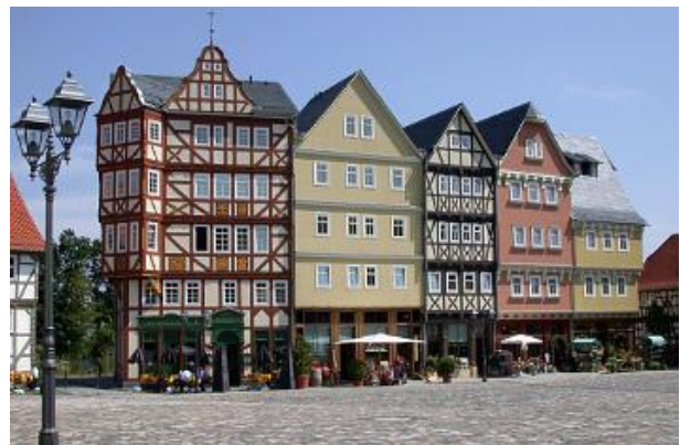
Der Marktplatz im Hessenpark